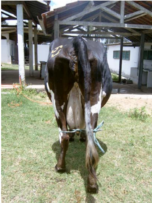
Fig.1. Abaulamento bilateral do abdômen do Bovino 28 com deslocamento do abomaso à direita, mais evidente no antímero ventral direito.

exploratória devido peritonite difusa e/ou alterações graves na serosa do abomaso, totalizando 18 casos cirúrgicos. Dois casos (Bovinos 7 e 9) foram encaminhados para abate por opção do proprietário após avaliação da relação custo-benefício. Três vacas (Bovinos 33, 34 e 36) chegaram prostradas e morreram em até oito horas, sem receber nenhum tipo de tratamento.