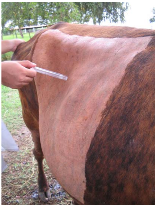
Fig.4. Fossa paralombar direita do Bovino 22 após tricotomia. É evidenciada estrutura similar a uma víscera distendida em formato de meia-lua.

bastonetes superior ao de neutrófilos segmentados, enquanto no Bovino 36 evidenciou-se o quadro de leucocitose por neutrofilia com desvio à esquerda regenerativo. A hiperfibrinogenemia ( >700\text{mg/dL} ), observada em 11 dos 26 bovinos (42,3%), foi um achado comum nos três grupos (DAE, DAD e VA). Alguns animais apresentaram hiperproteinemia associada ao leve aumento do valor do hematócrito (2/36), enquanto outros revelaram discreta acentuada hipoproteinemia (8/36). Os demais parâmetros encontravam-se dentro dos limites fisiológicos para a espécie (Kramer 2000). Os animais submetidos ao teste de IDGA (Bovinos 3, 4 e 6) resultaram positivos para LEB.