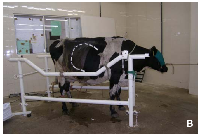
Fig.3. Delimitação de área com som de chapinhar metálico ultrapassando a última costela em vacas com deslocamento do abomaso à direita, (A) Bovino 11, (B) Bovino 30.