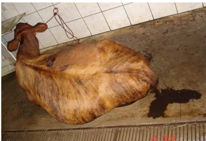
Fig.2. Bovino 22 com deslocamento do abomaso à direita apresentando fezes escassas, liquefeitas, enegrecidas e com odor fétido.

Os casos de DA apresentaram a seguinte distribuição durante as estações no período estudado: 20 casos (55,5%) na estação seca (meados de setembro a fevereiro) e 16 casos (44,5%) na estação chuvosa (março a agosto).